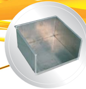
Adaptateur optionnel pour 4 seaux carrés.