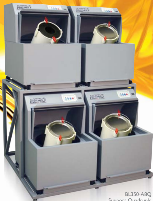
BL350-A8Q Support Quadruple