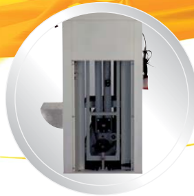
Entretien Facile- Des panneaux latéraux détachables fournissent un accès rapide et pratique pour l'entretien périodique.