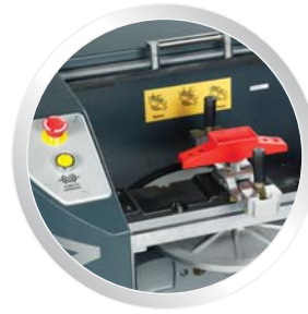
Mécanisme de serrure