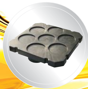
Plateau pour 7 seaux de 1 quart