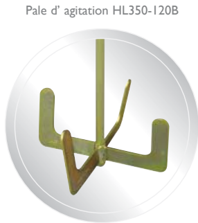
Pale d' agitation HL350-120B