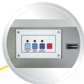
Minuterie électronique optional de 3 boutons